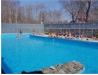
Бассейн с термальной водой